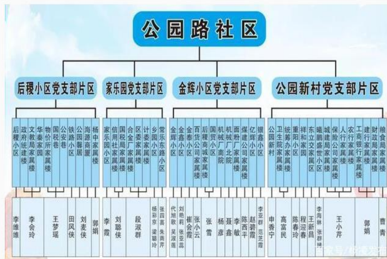
公园路社区组织机构图